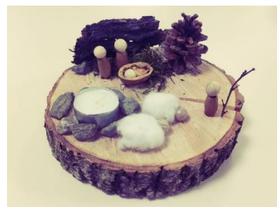
Fotos: wir bei unserer Aufnahmeprüfung und Gruppe; Adventsbesinnung (Besuch bei den selbst gebauten "Wegkrippeen" in Lebensgröße); Adventsbasteln in der kath. Pfarrei

Zu den Pfadfindern sind wir über die Mitarbeit bei "VIVIT - Forum für Bildung und Begegnung" gestoßen. Dieser Name wird euch in Zukunft noch öfters begegnen, deshalb hier eine kurze Erklärung: "VIVIT" ist ein Verein, den wir im Herbst mitgründen durften, der zum Ziel hat übergemeindlich, überkonfessionell und interkulturell mit dem erlebbaren Jesus vertraut zu machen. "Vivit" (lat. "Er lebt") deutet auf Jesus Christus hin. Weil wir es mit einem lebendigen Jesus zu tun haben, der gesagt hat: "Ich lebe und ihr sollt auch leben", sind wir als Christen beauftragt diesen Jesus zu kennen und zu bekennen.